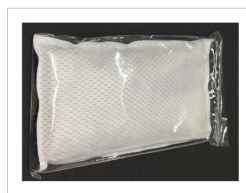
据え置き型・メッシュタイプ

臭いが気になる所の周囲に置き、空気中の原因気体を吸着します。芳香剤を含まないため、香料等が苦手な方にも安心してお使い頂けます。